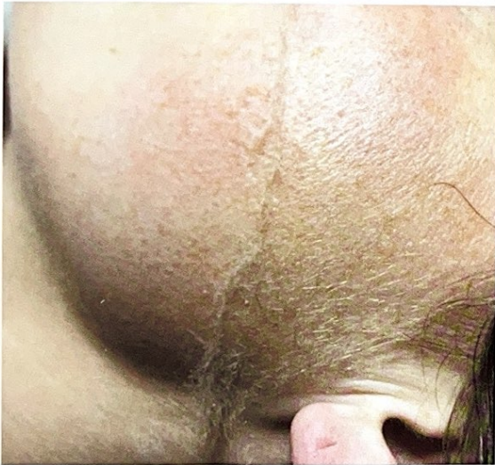
Verwijderen van donshaartjes, dode huidcellen en vuil