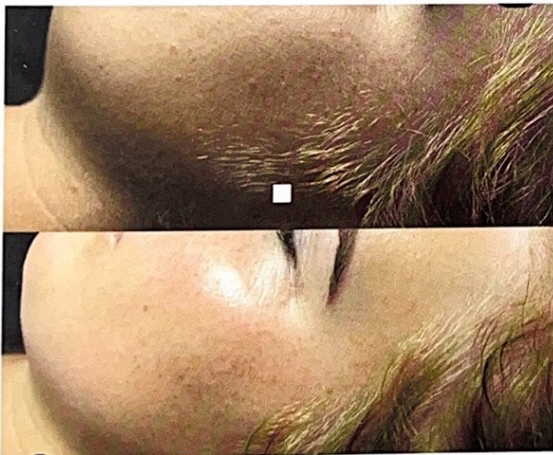
Egale teint, glow en een gladde huid na 1 behandeling